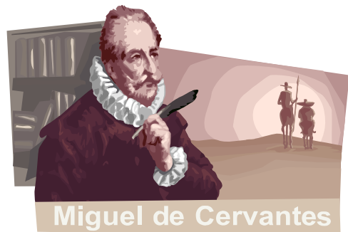
Miguel de Cervantes

"AUTOR PANAMEÑO, NUESTRO COMPROMISO ERES TU "