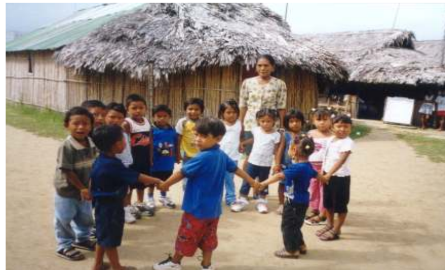
La Promotora enseña a niños y niñas de 4 y 5 años un juego que les ayuda a desarrollarse integralmente