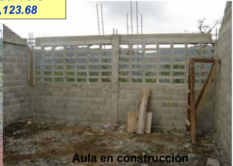
Aula en construcción