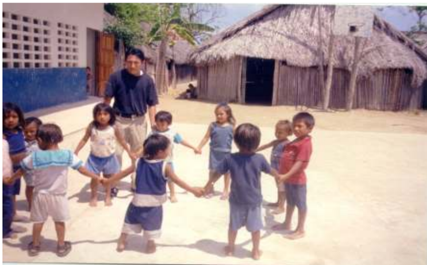
Niños del Cefacei de Isla Máquina en Kuna Yala con su promotor.