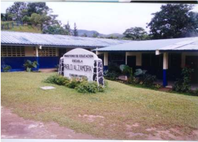
Uno de los centros de Telebásica creado en la provincia de Coclé es “ Pablo Alzamora”