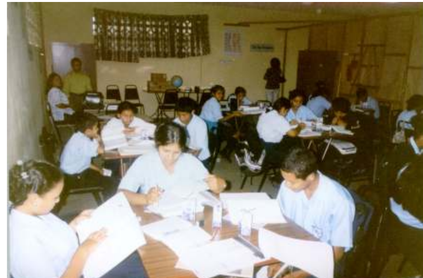
En los centros de telebásica se considera como centro de atención a los estudiantes y se crea las condiciones de trabajo para que desarrollen sus propias aptitudes.