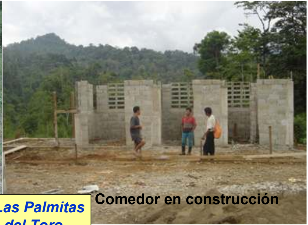
Comedor en construcción

Escuela Las Palmitas Bocas del Toro B/145,123.68