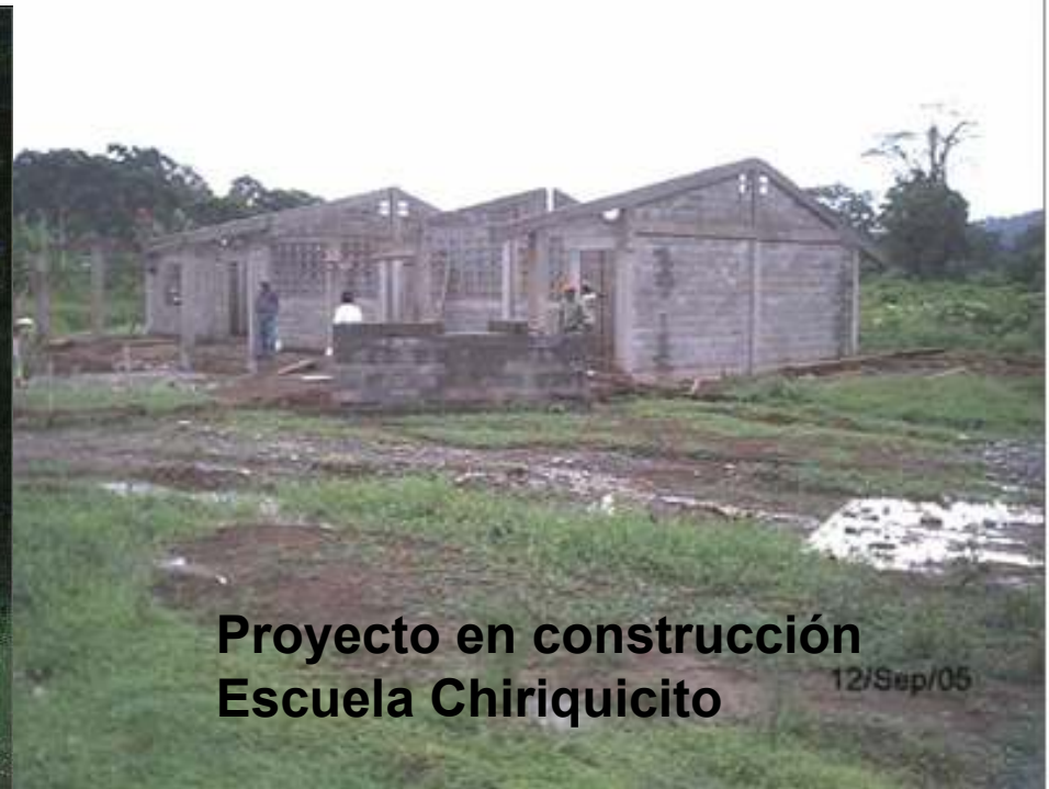
Proyecto en construcción Escuela Chiriquicito