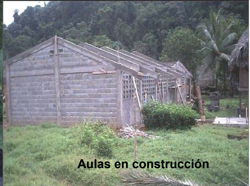
Aulas en construcción