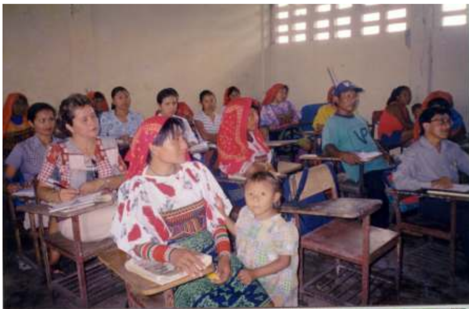
Focalización en la comunidad de Cartí Sugdup en Kuna Yala, con la participación de docentes y moradores de la comunidad.