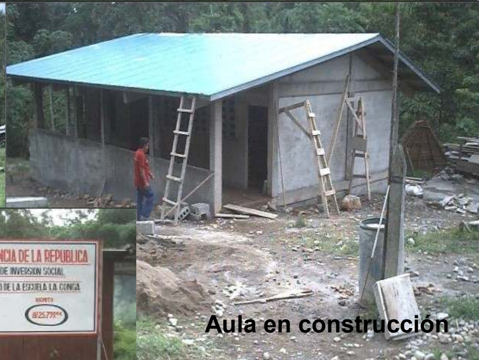
Aula en construcción