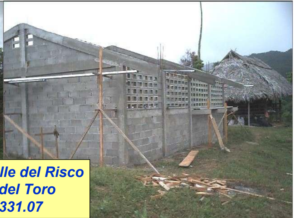
Escuela Valle del Risco Bocas del Toro B/82,331.07