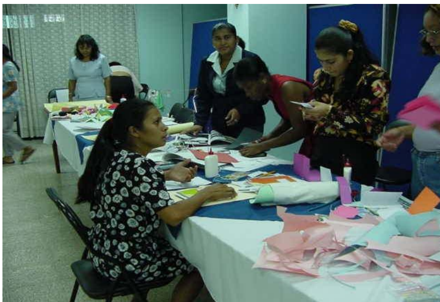
Promotores (as) en Jornadas de Trabajo realizadas durante las capacitaciones que se ofrecen al inicio y a mediados del año escolar.