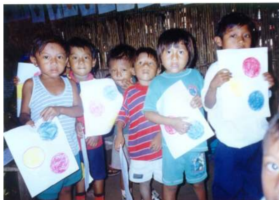
Niños y niñas de CEFACEI trabajando en grupo y mostrando el trabajo realizado.